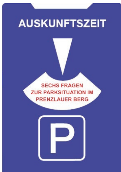
Fragebogen zur Parkplatzsituation im Prenzlauer Berg

Voraussetzung für die Einführung einer Parkraumbewirtschaftung sind zwei Faktoren. Zum einen muss ein hoher Parkdruck vorliegen. Dies ist zweifelsohne der Fall. Dieser muss aber zweitens durch die Konkurrenz unterschiedlicher Nutzergruppen der Parkräume entstehen.