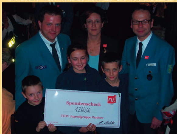
Übergabe des Spendenschecks an das THW Pankow

Im Laufe des Abends konnte die Kreisvorsitzende der Frauen